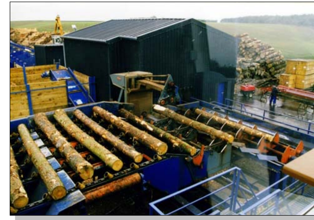
Rundholzanlage mit Wurzelreduzierung