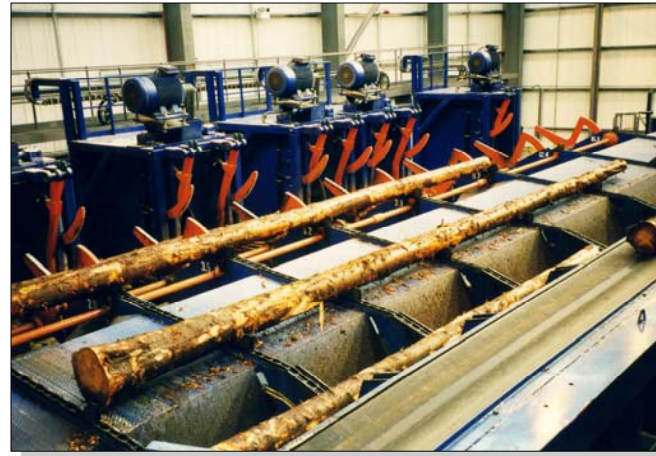
Hochleistungs-Durchlaufkappanlage für Langholz

Auch Maschinen für die Wurzelreduzierung und Entrindung können integriert werden.