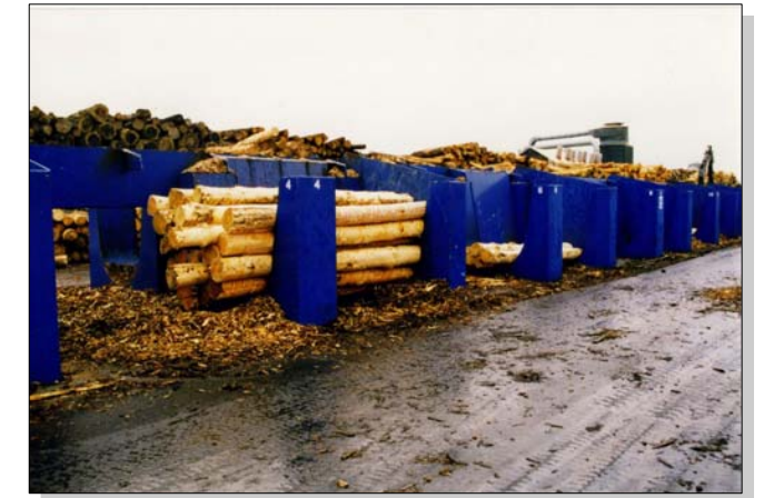
Rundholzsortieranlage mit Boxen für entrindetes Rundholz